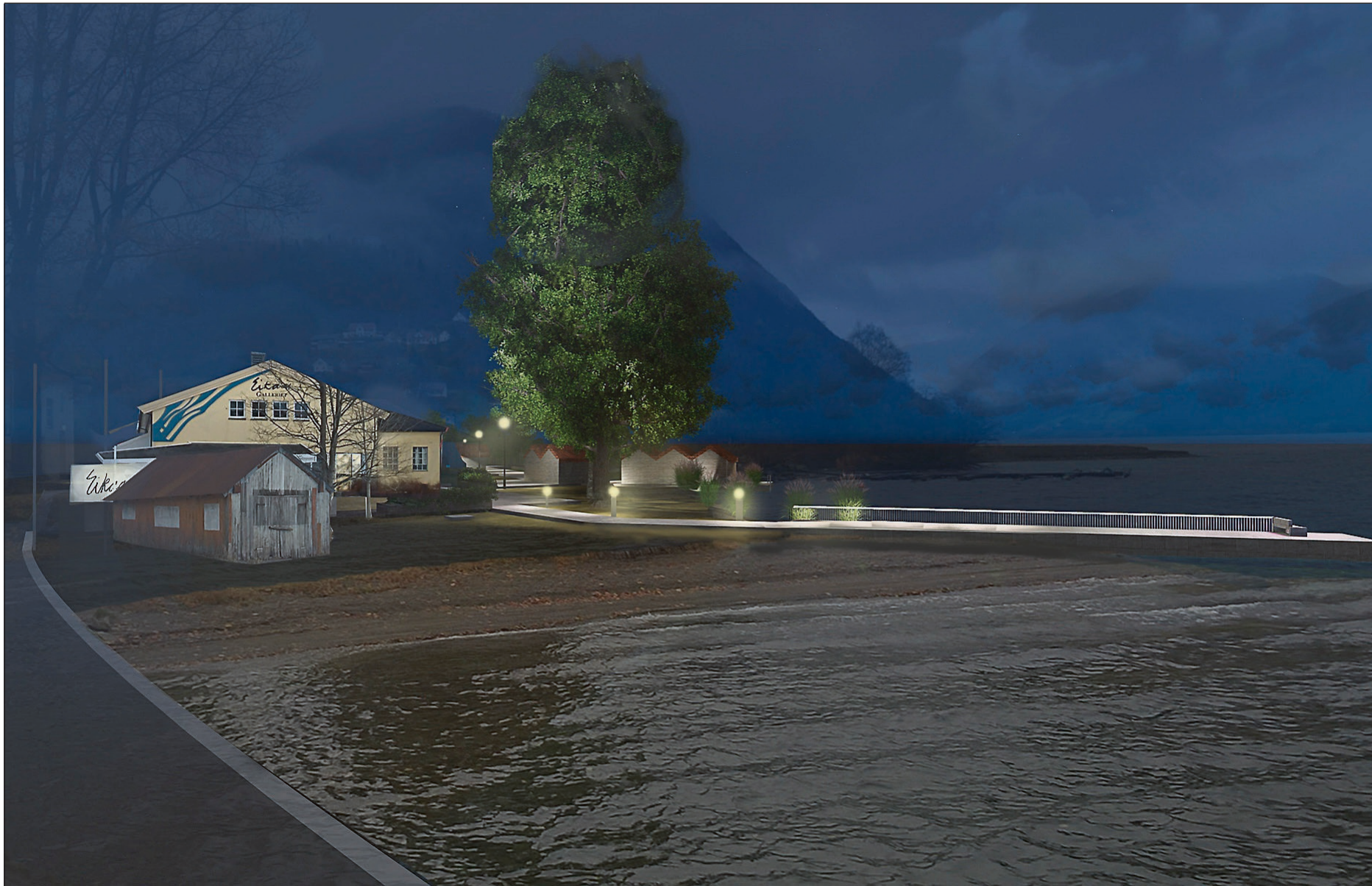
NY BADESTRAND: Dagens badestrand som vender mot E39 er foreslått flytta til nedsida på galleriet. Ein ønskjer også å legge nytt toppdekke på piren slik at også rullestolbrukarar kan nytte den.