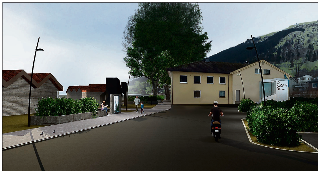
ERSTATTAST: Det gamle garasjebygget som står i dag vert foreslått rive og erstatta med eit nytt næringsbygg.