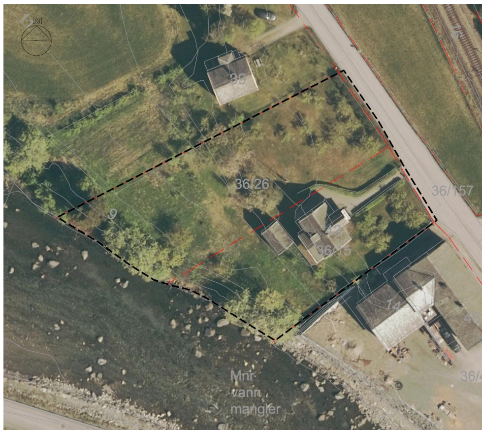
Forslag til planavgrensning.

Foreslått planavgrensning tek utgangspunkt i eigedomsgrensene. Endeleg planavgrensning vert avklart i oppstartsmøtet med Aurland kommune.