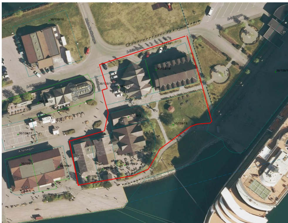
Forslag til planavgrensning (raud strek).

Foreslått planavgrensning tek utgangspunkt i eigedomsgrenser og formålsgrenser i gjeldande reguleringsplan. Endeleg planavgrensning vert avklart i oppstartsmøtet med Aurland kommune.