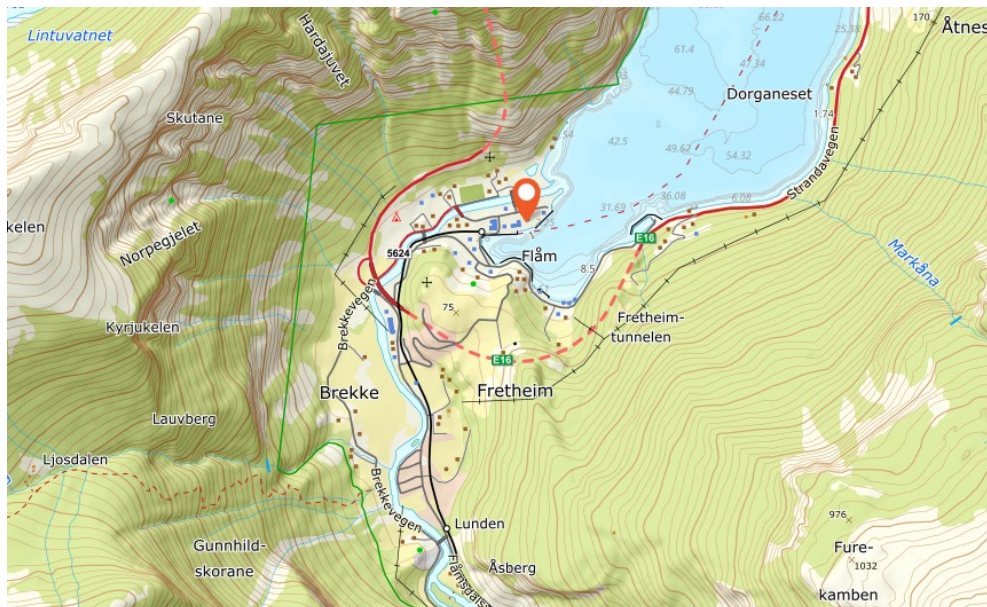
Planområdets lokalisering i Flåm sentrum merka med raud pin.

Foreslått planavgrensning tek utgangspunkt i eigedomsgrenser og formålsgrenser i gjeldande reguleringsplan. Endeleg planavgrensning vert avklart i oppstartsmøtet med Aurland kommune.